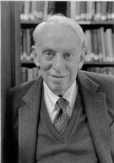
1918 – 2002 James Tobin – Джеймс Тобин

Если Qratio > 1, компания переоценена рынком (overvalued); если Qratio < 1, компания недооценена рынком (undervalued).